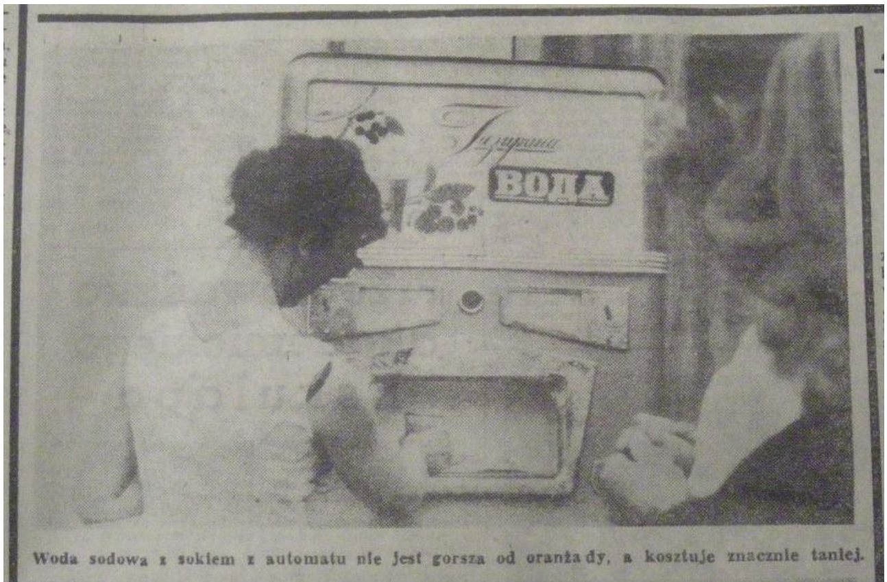
Woda sodowa z sokiem z automatu nie jest gorsza od oranżady, a kosztuje znacznie taniej.

PS. Podczas spotkania w kawiarni Pod Żukami (można tam dostać oranżadę!) obiecałam przypomnieć saturator – stał podobno zawsze na Placu Centralnym koło Cepelii. To nie ten sam ale jednak taki sam!!! Rok 1965.