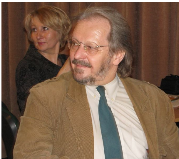
Pan Andrzej Bogunia-Paczyński